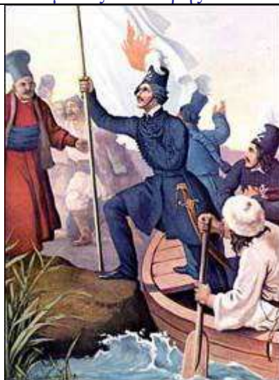
Peter von Hess: Ο Αλέξανδρος Υψηλάντης διέρχεται τον Προύθο Питер вон Хесс: Александр Ипсиланти переходит Прои́фос

Αξίζει να τονισθεί ότι κατά τη διάρκεια των Ρωσοτουρκικών πολέμων του 18 ου αι. (1768-1774, 1787-1791), ελληνικός πληθυσμός πολεμά στο πλευρό της Ρωσίας, η οποία αποτελεί τη μοναδική Ορθόδοξη Ευρωπαϊκή Δύναμη της εποχής, η οποία ταυτίζεται με τον αυτονόητο προστάτη του πληθυσμού της καθ' ημάς Ανατολής. Σύμφωνα δε με τη Συνθήκη του Κουτσούκ- Καϊναρτζή ο ελληνικός πληθυσμός χαίρει του δικαιώματος ελεύθερης διέλευσης των Στενών υπό ρωσική σημαία.