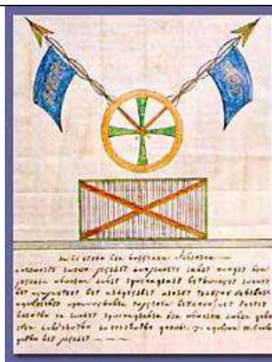
Σημαία της Φιλικής Εταιρείας Флаг «Филики Этерии»

Для православного населения Восточного Средиземноморья иноверное иго означало экономическую и духовную дискриминацию, тяжелейшее налоговое бремя, религиозные притеснения, в том числе запрет на строительство новых церквей, обращение в рабство, насильственное обращение в ислам (в частности маленьких детей), запрет на ношение оружия и прочие формы физического, морального и духовного унижения и уничтожение греческого христианского населения.