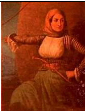
Λασκαρίνα Μπουμπουλίνα Ласкарина Бубулина

После этих поражения греки мобилизовали свои силы и в период с июля по август 1824 года провели несколько очень удачных морских сражений (в которых проявили себя такие предводители восставших масс, как Канарис, Мьяулис, Сахтурис). Кульминацией стало состоявшееся 28 августа 1824 года сражение у мыса Герондас в восточной части Эгейского моря, в котором объединенный турецко-египетский флот потерпел серьезное поражение и понес большие потери, в результате чего военные действия были приостановлены на целый год. На этом завершается первый этап Национально-Освободительной революции.