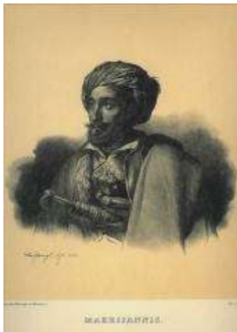
Ιωάννης Μακρυγιάννης Иоаннис Макрияннис

население, также утомленное внутренними распрями, покорилось захватчикам. В тот момент стало ясно, что без вмешательства Колокотрониса не обойтись, поэтому правительству Кундуриотиса пришлось освободить его из тюрьмы. Постепенно греки стали вытеснять захватчиков.