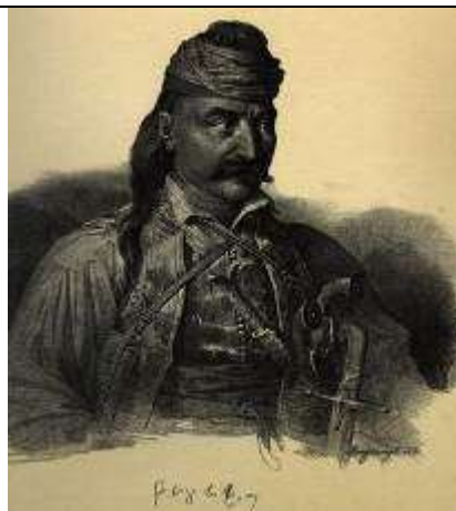
Karl Krazeisen (1794-1878). Θεόδωρος Κολοκοτρώνης Карл Кразейсен (1794-1878). Феофор Колокотронис.

2/ -Από την Πελοπόννησο στις 23 Μαρτίου 1821, όπου ο ιερωμένος Παπαφλέσσας, από τα ηγετικά στελέχη της Φιλικής Εταιρείας, κατόρθωσε να πείσει ορισμένους προκρίτους, που ακόμη αντιδρούσαν, και να προκαλέσει την έναρξη του Αγώνα. Εδώ τα πράγματα ήταν διαφορετικά, υπήρχαν πολλοί Έλληνες με στρατιωτική πείρα (ως αξιωματικοί και απλοί στρατιώτες στον αγγλικό στρατό στα Εφτάνησα, ως ναύτες στον τουρκικό πολεμικό στόλο, άλλοι είχαν την πείρα του κλέφτη και του αρματολού), ο δε ελληνικός πληθυσμός ήταν πυκνός και ομοιογενής.