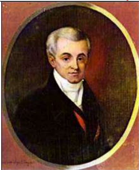
Ιωάννης Καποδίστριας Иоанн Каподистрия

Подготовку к восстанию против османского владычества взяло на себя Дружественное общество (Φιλική Εταιρεία), основанное в 1814 г. в Одессе тремя греческими купцами – Николаосом Скуфасом, Эммануилом Ксантосом и Атанасиосом Цакаловым. О целях Филики Этерии не должны были знать ни Османские власти, ни европейские державы, которые относились с осторожностью к различным повстанческим движениям, поэтому членство в Обществе оставалось тайным, а в его работе сохранялся конспиративный режим, что, безусловно, осложняло его деятельность. Дружественному обществу, вдохновленному идеями французской революции и организованному именно представителями буржуазии, предстояло преодолеть противодействие высшего духовенства и предводителей местных общин. Деятельности и реализации целей Дружественного Общества способствовала плохая организация османских секретных служб, а также общее разложение империи (внутренние конфликты с местными пашами и пр.) на фоне распространения либерального и революционного духа в Европе и на Балканах и созревания национально-освободительных идей в самом греческом обществе.