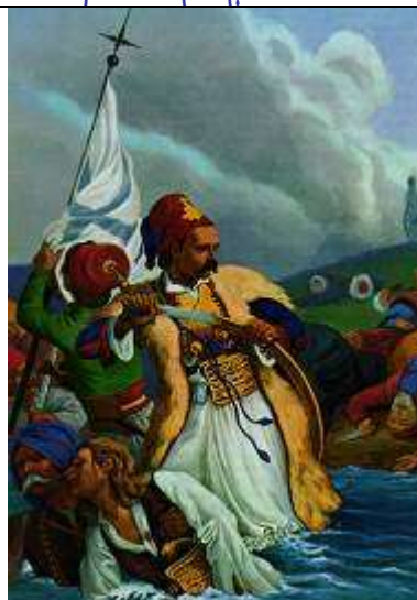
Ο χιλίαρχος Αθανάσιος Καρπενησιώτης (1780-1821) Военачальник Афанасий Карпенисиотис (1780-1821)

Таким образом, в 18 – начале 19 вв. духовное и национальное возрождение постепенно охватывает широкие массы, вызывая в них осознанное желание свергнуть иноземное иго. Труды греческого духовенства и греческих просветителей способствовали идейному созреванию населения, осознанию стоящих перед обществом национальных и социальных проблем. При этом все острее встает вопрос о выборе времени для восстания и устройстве будущего государства.