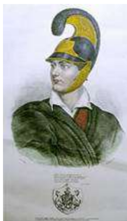
Ο Λόρδος Βύρων Лорд Байрон

В средней Греции началась вторая осада города Месолонги, которая длилась целый год – с 15 апреля 1825 по 11 апреля 1826 года и завершилась героическим выходом из осады мирного населения и массовой резней, которая потрясла всю Европу. В Месолонги умер от лихорадки и известный английский поэт, горячий филэллин Байрон.