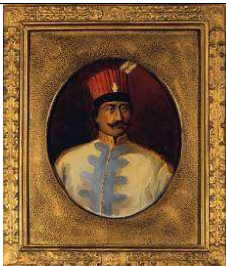
Λάμπρος Κασιώνης (1752-1804) Ламброс Кационис (1752-1804)

Η άλωση της Κωνσταντινούπολης από τους Οθωμανούς το 1453 και η κατάργηση της Βυζαντινής Αυτοκρατορίας αποτελούν την έναρξη μιας νέας περιόδου υπό ξένο ζυγό για το χριστιανικό πληθυσμό της Ανατολικής Ρωμαϊκής Αυτοκρατορίας. Ολοκληρωτικά όλος ο πληθυσμός της Βυζαντινής Αυτοκρατορίας υποκύπτει στους Οθωμανούς το 1669, με την πτώση του Χάνδακα (Ηρακλείου Κρήτης).