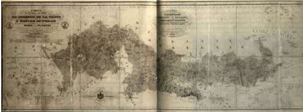
Χάρτης ορίων Ελλάδας - Οθωμανικού κράτους, του 1832 Карта с границами Греции и Оттоманской державы. 1832 г.

Στο μεταξύ είχε φτάσει στην Ελλάδα ο Ιωάννης Καποδίστριας (6 Ιανουαρίου 1828) και μια από τις πρώτες και κύριες προσπάθειές του ήταν να περιληφθούν στο κράτος όσο γινόταν περισσότερα εδάφη. Επέμενε, μάλιστα, ιδιαίτερα να περιληφθεί η Κρήτη.